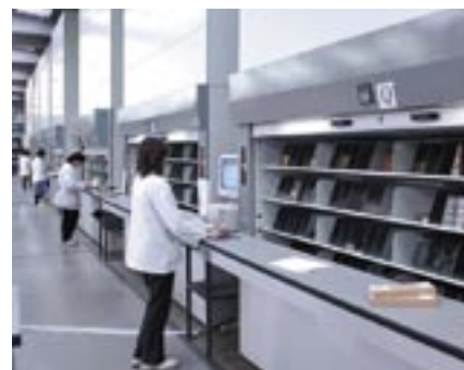
Dinema si occupa della gestione completa del prodotto, avvalendosi di ben 8 magazzini automatici

Dinema si propone infatti come partner ideale per soluzioni a 360 gradi nelle svariate applicazioni dell'elettronica e dell'automazione industriale, in grado di gestire l'intero flusso produttivo, dal design al post-vendita, al fine di garantire la completa soddisfazione del cliente.