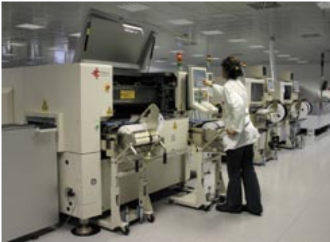
Nel 2004 nasce la nuova linea di assemblaggio per produzione di schede altamente professionali